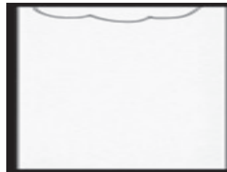
Abb. 2: Ein Blatt mit einer 3-gliedrigen Wolke zum »Eskimo-Stormen«

Mit Überraschung stellen alle fest, dass es die Ungeübten leicht auf 6 bis 16 Einfälle gebracht haben, und geübt Offenerer sogar spontan mehr als 30 Einfälle aufschreiben konnten. Nachher können alle mithilfe von Formen des »OPTI-Stormens« (s. u.), von denen das Eskimo-Stormen eine Unterform ist, sofort zu jedem Thema Faszinierendes sicht- und nutzbar machen.