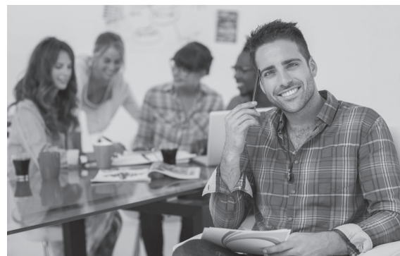
Abb. 1: Beim »Eskimo-Stormen« wird eine Minute lang unentwegt geschrieben, stockt der Stift, wird das Wort »Eskimo« notiert, bis neue Ideen fließen

Die »Eskimo-Methode« erlaubt es jedem Einzelnen, in einer Minute zu jeder Frage, zu jedem Thema aus dem Stand